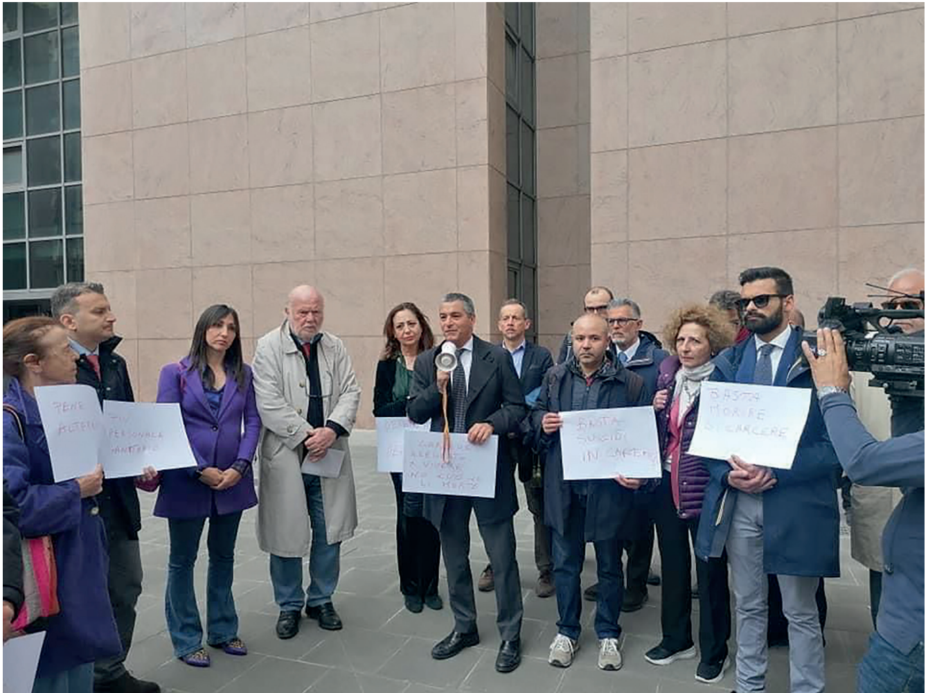
Il sit in dello scorso 24 aprile in tribunale per accendere i riflettori sull'emergenza carceri