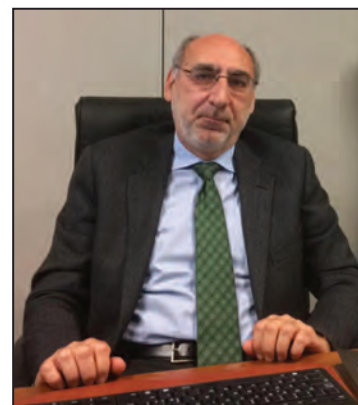
Presidente Alfredo Montalto

'I giudici si sono ritirati in Camera di Consiglio'. Un'espressione che abbiamo sentito tante volte. Una fase che può durare tanti giorni e che ha innanzitutto una caratteristica: quella di svolgersi in assenza di pubblico.