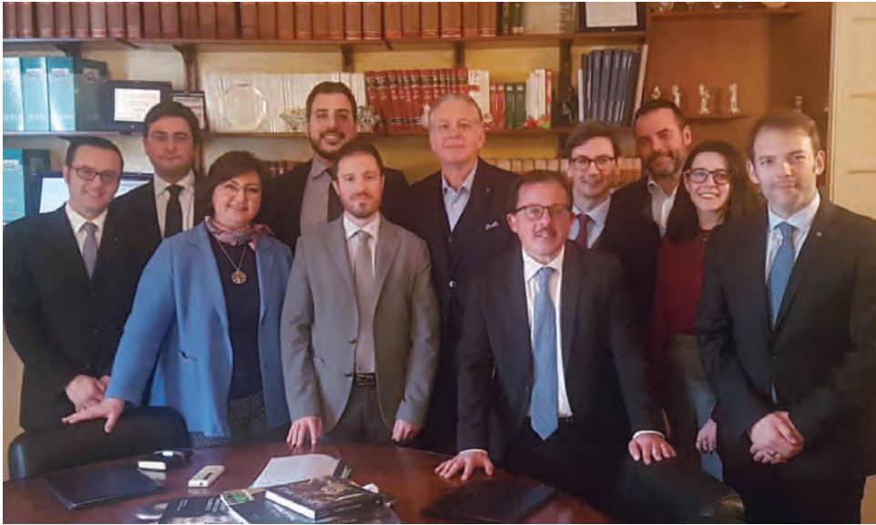
Nuovo Direttivo Jus

vità di servizio all'Avvocatura, che vedranno presente ( Jus ) nella segnalazione, trattazione e suggerimenti per la risoluzione dei piccoli e grandi problemi che quotidianamente affliggono la professione forense.