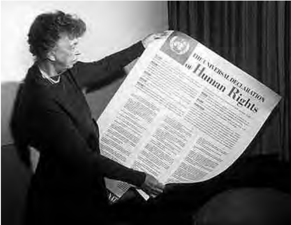
Eleanor Roosevelt e la Dichiarazione dei Diritti Umani

Nei giorni scorsi in Italia, è arrivato il Presidente della Cina, XiJinping ed anche il capoluogo siciliano, si è fatto in quattro per ricevere il Presidente con tutti gli onori, dimenticando le sistematiche violazioni dei diritti umani che avvengono quotidianamente e sistematicamente in questo paese. Il presidente Mattarella ha invocato l'apertura di un dialogo sul tema e XiJinping ha risposto positivamente, quindi, attendiamo fiduciosi che tale dialogo possa portare i risultati sperati.